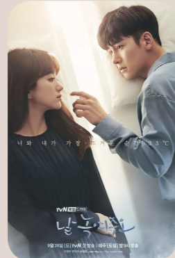
Melting me softly Season 01