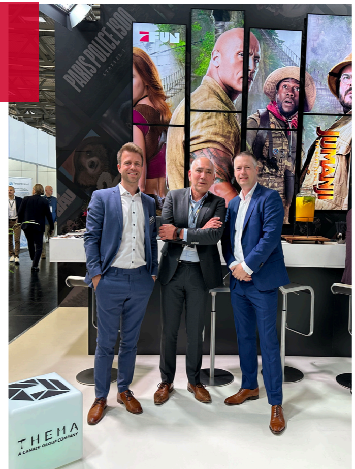
ANGACOM GERMANY 23-25 May 2023 / THEMA and M7 Group.