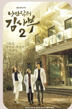
Dr. Romantic Season 02