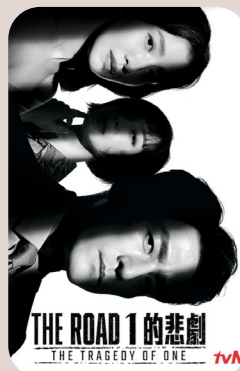
The Road : Tragedy of one Season 01