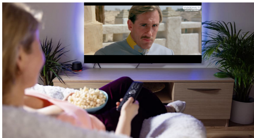
StudioCanal TV campaign on Artv and RDI – May 12th to June 9th.

During this period, viewers were able to enjoy special programming featuring the iconic films and series of StudioCanal.