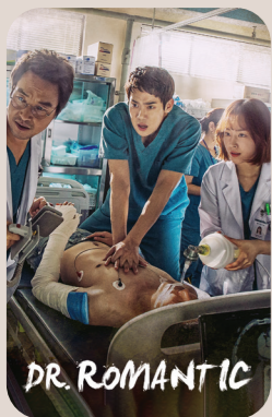
Dr. Romantic Season 01