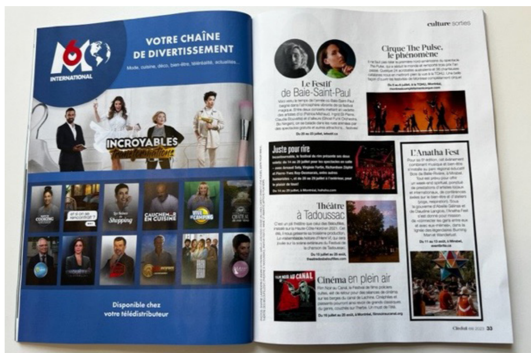
Full-page in the popular Quebec magazine "Clin d'oeil".

«Clin d'oeil» and «Le Devoir» magazines promoted M6 International TV channel. These campaigns boosted awareness of the channel, promoting its availability in Quebec and drawing attention to its attractive programming!