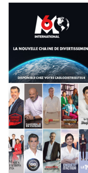
M6 International digital campaign on « Le Devoir » website – 29th-30th April.